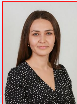
Старший воспитатель Высшая кв. категория